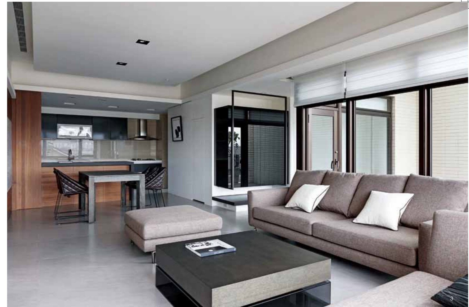
1.客、餐廳、吧台、廚房均以開放的定義連貫牽動機能、情感、視角上的互動，圍塑開闊通透的空間感受。2.客廳藉由木化石天然紋理圍塑主牆意象，回應戶外綠意環境，給予空間絕對自然自在的生活意念。3.沙發後方規劃室外花園，利用落地玻璃界定內外關係，引入自然光源，延伸空間感受。4.餐廳無隔牆的規劃與廳區構成通透連結，不僅維繫廳區整體的開闊性，安排場域的自由度。